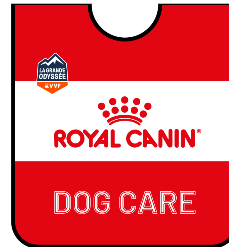
CHASUBLE ROYAL CANIN DOG CARE

Le Prix Royal Canin Best Dog Care sera remis une seule fois lors du podium final, au musher qui aura pris le plus soin de ses chiens tout en recherchant la performance.