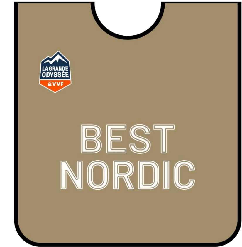
CHASUBLE BEST NORDIC

Quotidiennement, le Prix Royal Canin Dog Care sera décerné à un musher, pour mettre en avant une action remarquable, allant dans le sens de la Santé Animale.