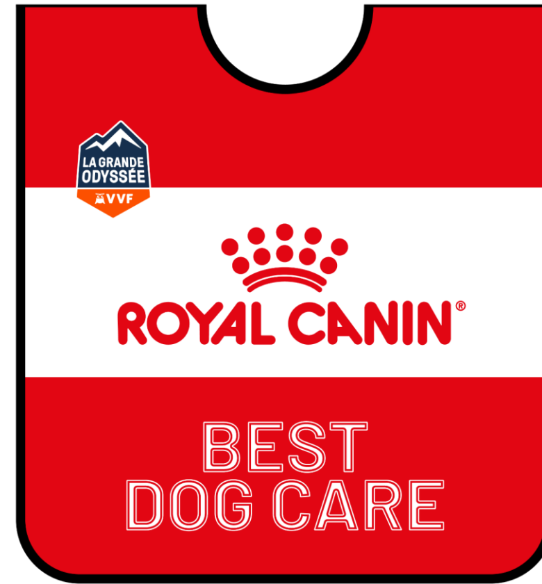
CHASUBLE ROYAL CANIN BEST DOG CARE

Chaque jour, les mushers en tête de chaque course au classement général portent les chasubles Leader.